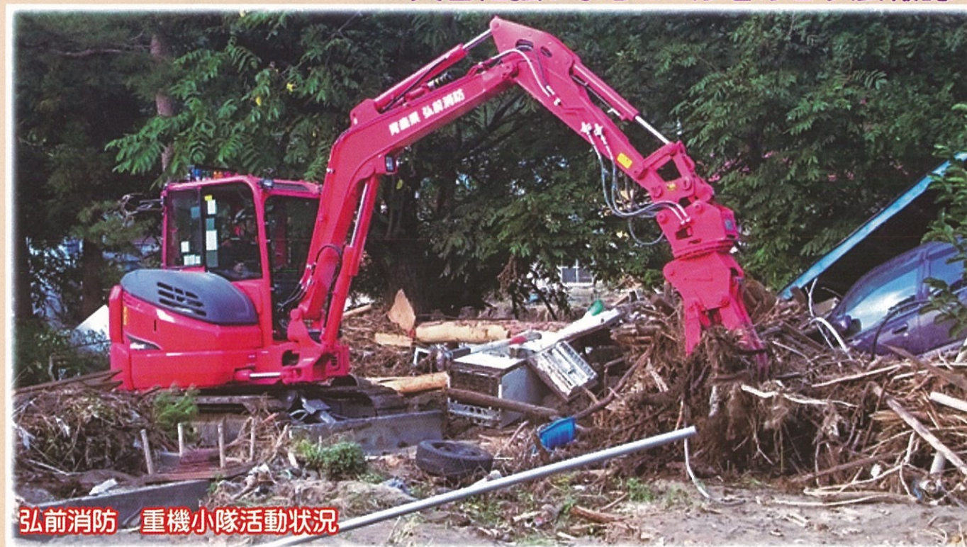
弘前消防 重機小隊活動状況