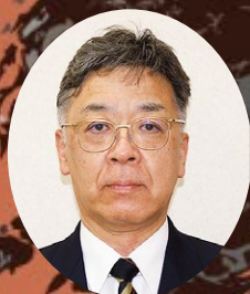
弘前地区消防事務組合