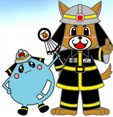
ようじんちゃん 消防犬 火けしくん 弘前地区消防事務組合マスコットキャラクター