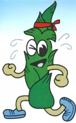
たけっこくん たけのこマラソン公認キャラクター