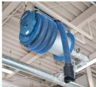
車庫排気排煙装置