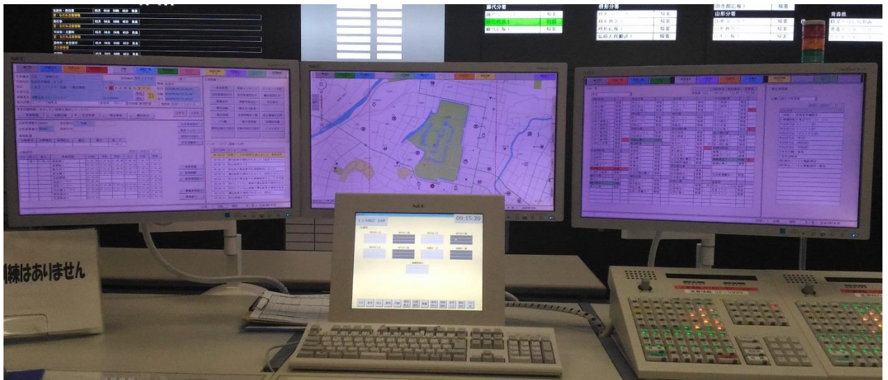
指令センター内指令台画面状況